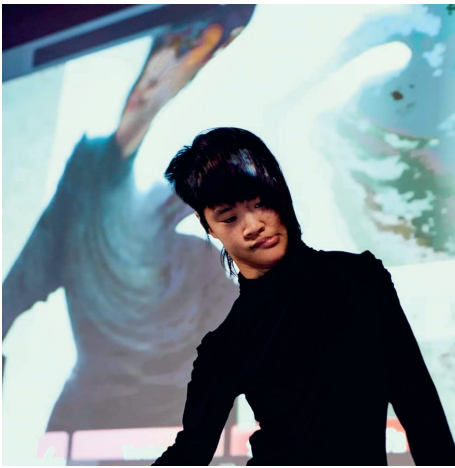
Portrait de No Anger