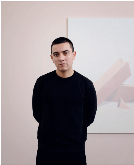
Portrait de Iván Argote