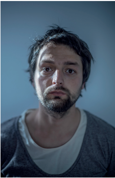
Portrait d'Alexander Gronsky