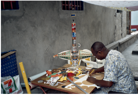
Portrait de Bodys Isek Kingelez, Kinshasa, 1994