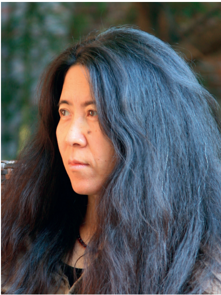
Portrait de Yin Xiuzhen, 2012