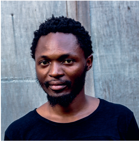
Portrait de Sinzo Aanza